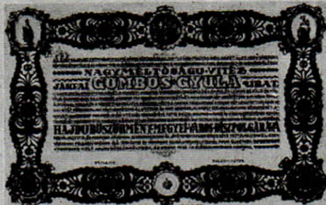
Hajduböszörmény díszpolgári oklevele, amelyet vasárnap személyesen vesz át Hajduböszörményben Gömbös Gyula miniszterelnök. Az oklevelet Madáchy István gimn. tanár, festő- és iparművész készítette.

Kedves Lixike! A Pesti Hírlap közölte ezen oklevelem feny- képét. Elküldöm neked, mert tudom, hogy érdekel téged. Hal- lom, sokat kórcsolyáskod. Hasz- náljator is ki a szívedet sző- rakozásra. Gyereketekkel csókol Miskolc, 1933. II. 2. Patacsai